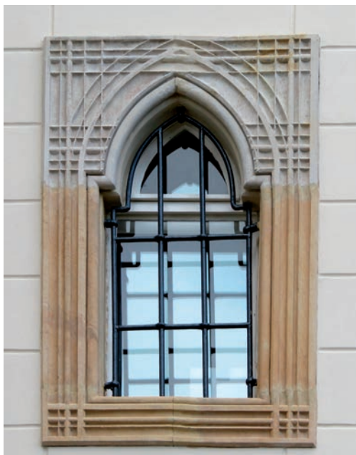
Neogotyckie ościeże okna: stan przed renowacją (2019 r.) i po renowacji

barwie jasnopiaskowej na podstawie wzornika KEIM Exclusiv nr 9274. Jeden z najcenniejszych zabytków, wpisany na listę dziedzictwa narodowego, odzyskał dzięki temu dawną, pierwotną świetność. Z perspektywy kilku lat użyte materiały bardzo dobrze sprawdzają się zarówno od strony technologicznej, jak i estetycznej.