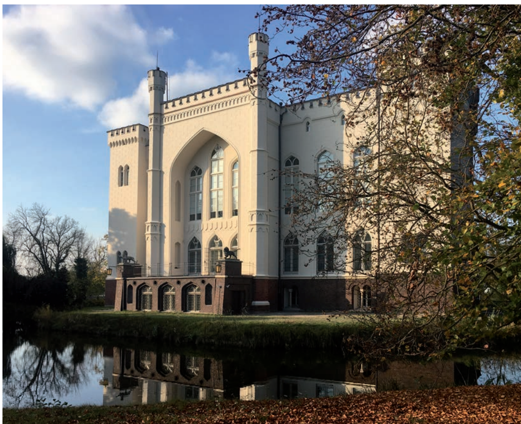
Elewacja południowa zamku po renowacji, widok od strony południowo-wschodniej