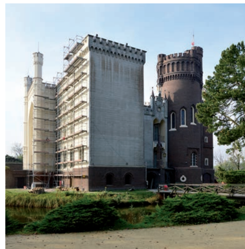
Elewacja wschodnia zamku w trakcie renowacji (2019 r.)

W latach 60. XX w. przeprowadzono renowację elewacji, w czasie której