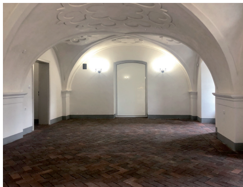
Parter, pasmo zachodnie, wnętrze sali barokowej ku wschodowi – stan po pracach