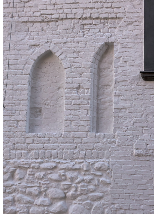
Elewacja północna, detal blend gotyckich – stan po pracach

na elewacji północnej zostały uczytelnione poprzez uzupełnienie brakujących elementów obramień. Podobne rozwiązanie zastosowano w przypadku ceglano-fryzowej elewacji zachodniej. Zarys okien i wnęk szczytu zachodniego, a także zarys sklepień na elewacji wschodniej uwypuklono poprzez pogłębienie krawędzi. Ze względu na liczne prace murarskie, a także uszkodzenia, zrezygnowano z ekspozycji czystego lica ceglano-fryzowej elewacji zachodniej. Na podstawie wyników badań przywrócono kolorystykę barokową z elewacją w kolorze starej bieli i z grafitowym detalem. Wyeksponowano oraz uczytelniono historyczne nawarstwienia. Do prac elewacyjnych zastosowano materiały firmy KEIM: grunt wzmacniający Spezial Fixativ, na który położono szlamującą farbę krzemianową Contact Plus. Na warstwę wykończeniową zaproponowano farbę elewacyjną zolowo-krzemianową Soldalit.