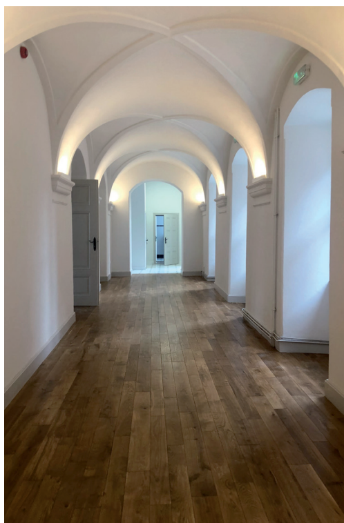
Parter, pasmo środkowe, barokowy korytarz traktu frontowego ku zachodowi – stan po pracach