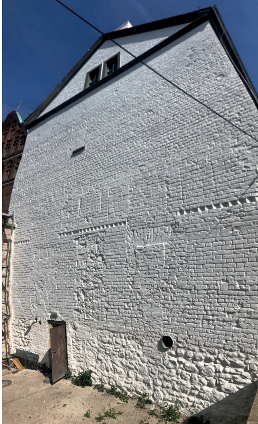
Elewacja zachodnia – stan po pracach