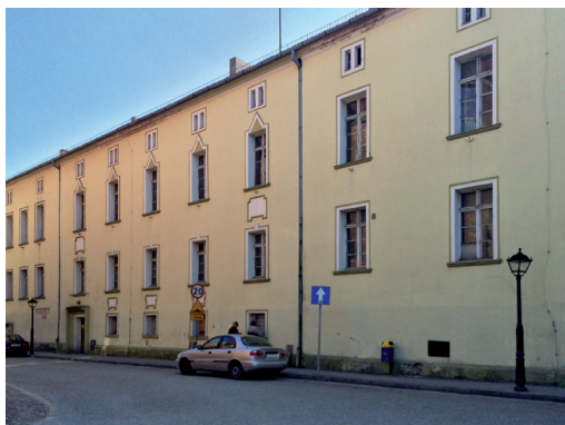
Widok od północnego zachodu – stan przed pracami

wnękami. Szczyt zachodni dekorowało pięć ostrołucznych wysokich blend. We wnętrzu, w jego zachodniej partii, ukształtowano dużą salę, a pozostałe podziały wykonano zapewne ścianami drewnianymi. Prawdopodobnie w 2. poł. XIV wieku budynek powiększono w kierunku wschodnim oraz dobudowano skrzydła od południa. Klasztor połączono arkadowym gankiem z kościołem. We wnętrzu wydzielono dwie duże sale na parterze i na piętrze. Przypuszczalnie na przełomie XVI i XVII wieku oba wnętrza nakryto sklepieniami opartymi na centralny filarze, oraz wprowadzono pod nimi piwnicę. Najpoważniejsza barokowa przebudowa zrealizowana została zapewne po pożarze w 1702 roku, kiedy to budynek podwyższono o jedną kondygnację, nakryto czterospadowym dachem i wykonano skromny wystrój elewacji. We wnętrzach wprowadzono zachowane do dziś podziały obejmujące dwie sale od południa, korytarz wzdłuż elewacji północnej oraz pomieszczenia przy elewacji zachodniej. Przekształcenia zrealizowane w połowie XIX wieku wprowadziły nowy neoklasycystyczny wystrój elewacji. We wnętrzach zmiany podyktowane były znacznym podwyższeniem terenu od strony północnej i wprowadzeniem nowego wejścia