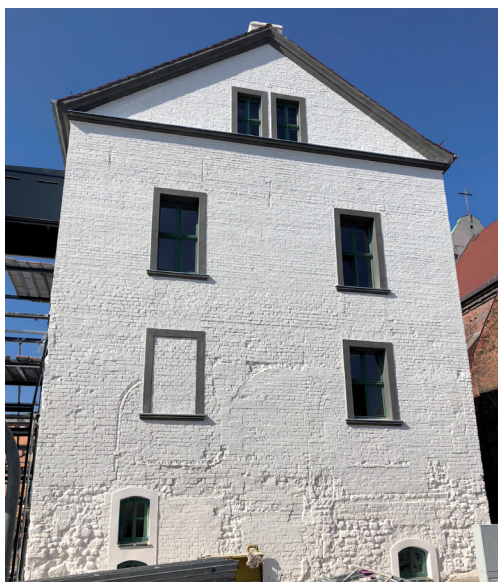
Elewacja wschodnia – stan po pracach

Podjęto decyzję o wyeksponowaniu zachowanego wystroju średniowiecznej elewacji klasztoru (m.in. ostrołucznych wnek, płycin i fryzów). Problematiczne było zachowanie ceglanego lica z uwagi na jego zniszczenia. Pełna rekonstrukcja gotyckiej elewacji północnej okazała się niemożliwa z uwagi na zachowane barokowe okna. Podjęto zatem decyzję o ekspozycji jej fragmentów bez zmiany zachowanego obecnie układu otworów okiennych i drzwiowych. Gotyckie wneki odkryte