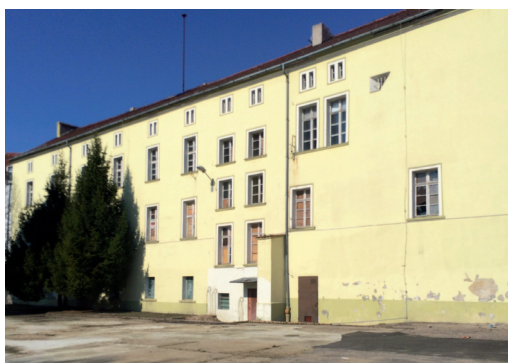
Widok od południa – stan przed pracami

wnękami. Szczyt zachodni dekorowało pięć ostrołucznych wysokich blend. We wnętrzu, w jego zachodniej partii, ukształtowano dużą salę, a pozostałe podziały wykonano zapewne ścianami drewnianymi. Prawdopodobnie w 2. poł. XIV wieku budynek powiększono w kierunku wschodnim oraz dobudowano skrzydła od południa. Klasztor połączono arkadowym gankiem z kościołem. We wnętrzu wydzielono dwie duże sale na parterze i na piętrze. Przypuszczalnie na przełomie XVI i XVII wieku oba wnętrza nakryto sklepieniami opartymi na centralny filarze, oraz wprowadzono pod nimi piwnicę. Najpoważniejsza barokowa przebudowa zrealizowana została zapewne po pożarze w 1702 roku, kiedy to budynek podwyższono o jedną kondygnację, nakryto czterospadowym dachem i wykonano skromny wystrój elewacji. We wnętrzach wprowadzono zachowane do dziś podziały obejmujące dwie sale od południa, korytarz wzdłuż elewacji północnej oraz pomieszczenia przy elewacji zachodniej. Przekształcenia zrealizowane w połowie XIX wieku wprowadziły nowy neoklasycystyczny wystrój elewacji. We wnętrzach zmiany podyktowane były znacznym podwyższeniem terenu od strony północnej i wprowadzeniem nowego wejścia