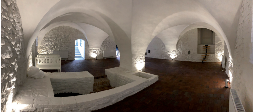
Parter, pasmo wschodnie, wnętrze sali renesansowej ku zachodowi – stan po pracach

relikwów, zrekonstruowano ceglane posadzki. Zdecydowano się również na wyeksponowanie na ścianach sali zachodniej fragmentów kamiennego lica. Zachowano i poddano pracom konserwatorskim posadzki dwóch komór w piwnicach. Wnętrza parteru zostały zaadaptowane na potrzeby muzeum i kawiarni.