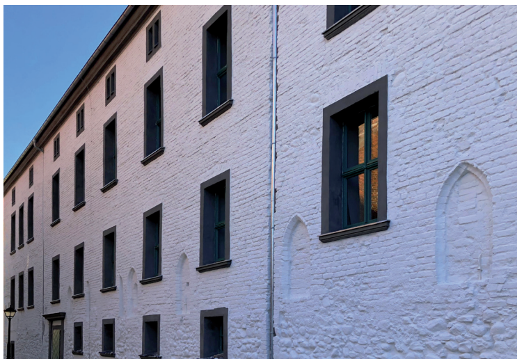
Widok od północnego zachodu – stan po pracach

z placu Kościelnego. W trakcie remontu zrealizowanego w drugiej połowie lat 30. XX wieku uproszczono wystrój elewacji, zmieniono układ sali renesansowej na pierwszym piętrze, rozbierając jej sklepienie.