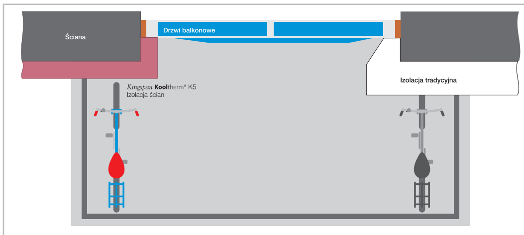
Rys. 3. Różnica w ograniczeniu powierzchni powierzchni przy stosowaniu tradycyjnej termoizolacji i Kooltherm K5.

Powszechną praktyką podczas prowadzenia prac termomodernizacyjnych jest ocieplenie zewnętrznych ościeży okiennych, tzw. węgarów, warstwą styropianu o grubości zaledwie 2–3 cm, co powoduje powstanie potężnych mostków termicznych, w efekcie których gruba warstwa izolacji zewnętrznej traci swoją skuteczność tym bardziej, im gęściej rozmieszczone są okna. Najjaskrawiej uwidacznia się to w wielorodzinnym budownictwie mieszkaniowym. Zastosowanie w tym przypadku płyt Kooltherm K5 ma zdecydowany wpływ na późniejsze zapotrzebowanie na energię potrzebną do ogrzania budynku.