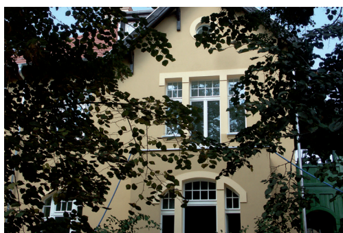
Fot. 2. (po lewej) Odtworzony pierwotny wygląd elewacji.