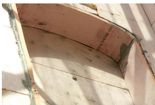
Fot. 1. Pianka rezolowa użyta do izolacji blendy.