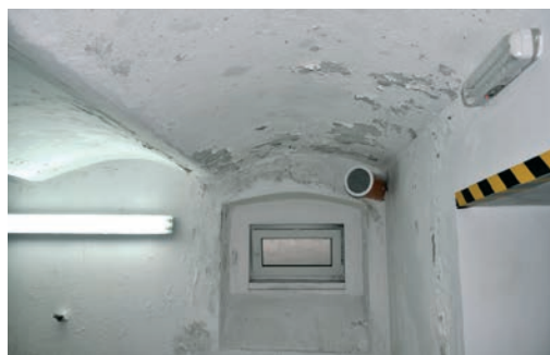
Stopnie zasolenia wg instrukcji WTA nr 2-9-04

Tynki anhydrytowe w pomieszczeniu wilgotnym.