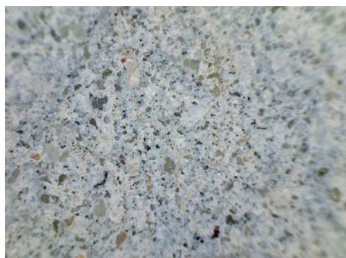
Zwykły tynk (powiększenie x 200).