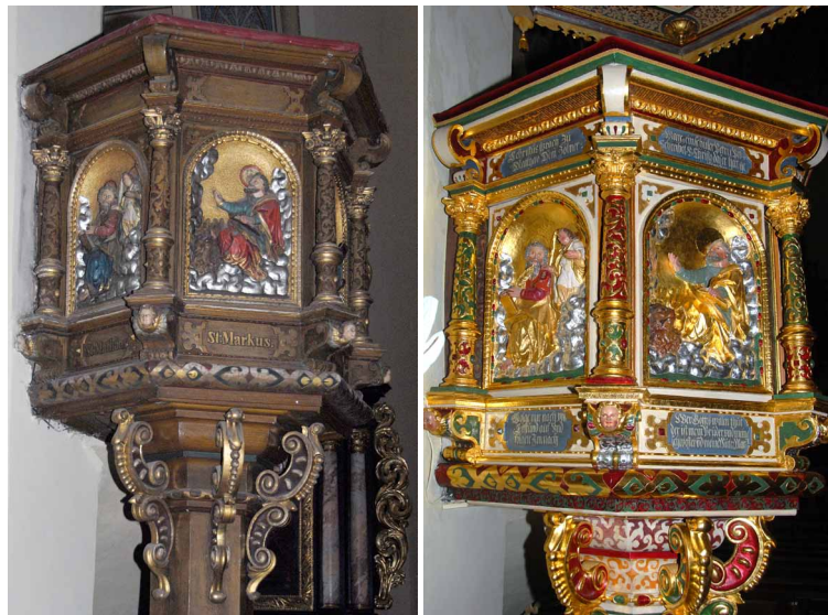
Kosz i podstawa ambony, stan przed konserwacją, czerwiec 2012.