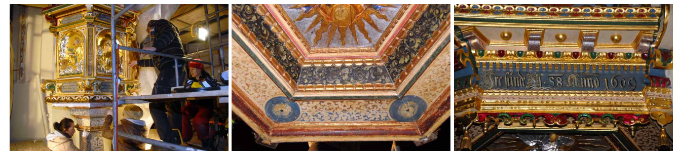
Prace konserwatorskie – usuwanie przemalowań i wypełnianie ubytków struktury.