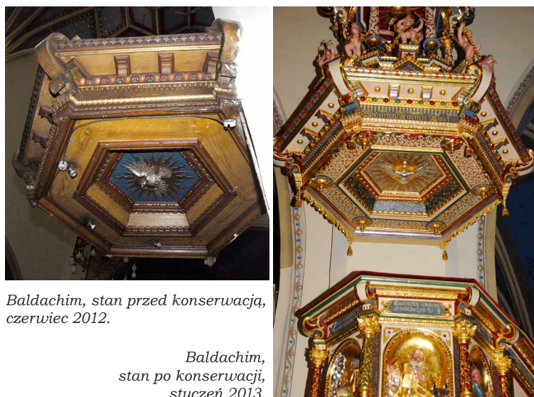
Baldachim, stan przed konserwacją, czerwiec 2012.