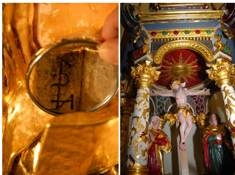
Odsłonięty monogram jednego z twórców ambony – Caspara Pohla.