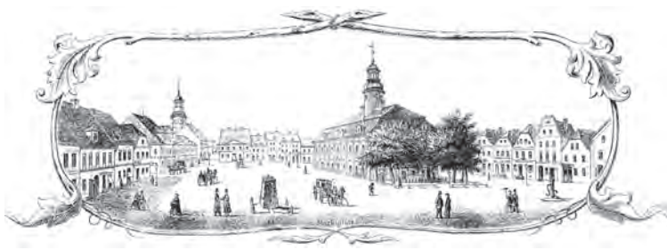
Stary widok na rynek w Rawiczu

Po przeprowadzonym w 2015 r. remoncie ratusz ponownie jest ozdobą rawickiego rynku i oryginalnego układu urbanistycznego. Przy renowacji elewacji wykorzystano farby żolowo-krzemianowe KEIM Soldalit, a do malowania elementów drewnianych stosowano system farb mineralnych KEIM Lignosil.