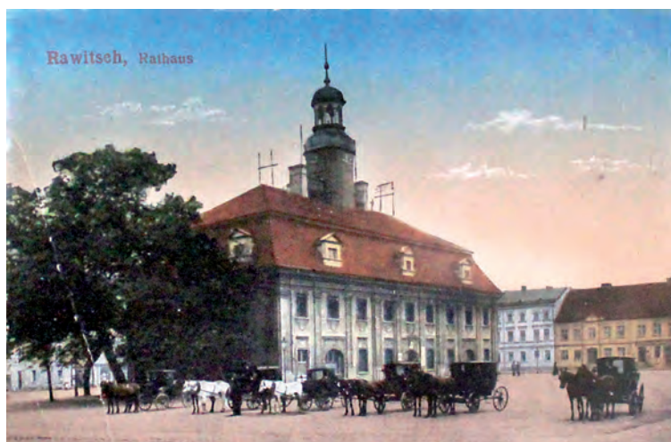
Reprodukcja karty pocztowej