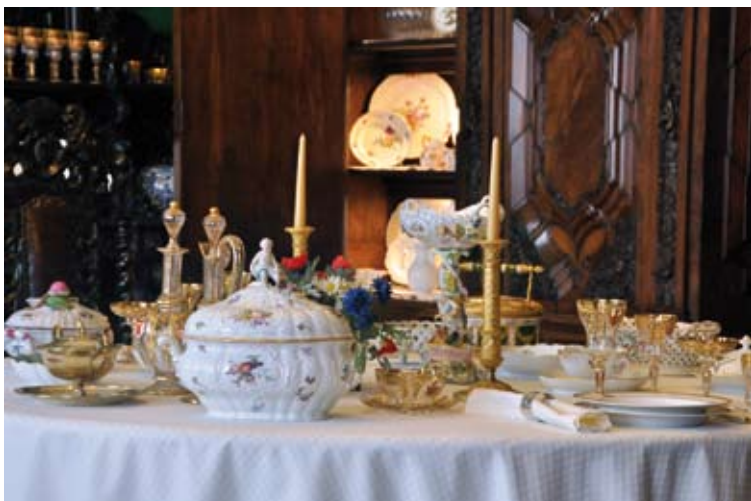
Jadalnia; na stole m.in.: porcelanowa teryna (waza do zupy), Saksonia, Miśnia, ok. 1760 r. i serwis szklany z herbami Zamoyskich, Francja, 4. ćw. XIX w..