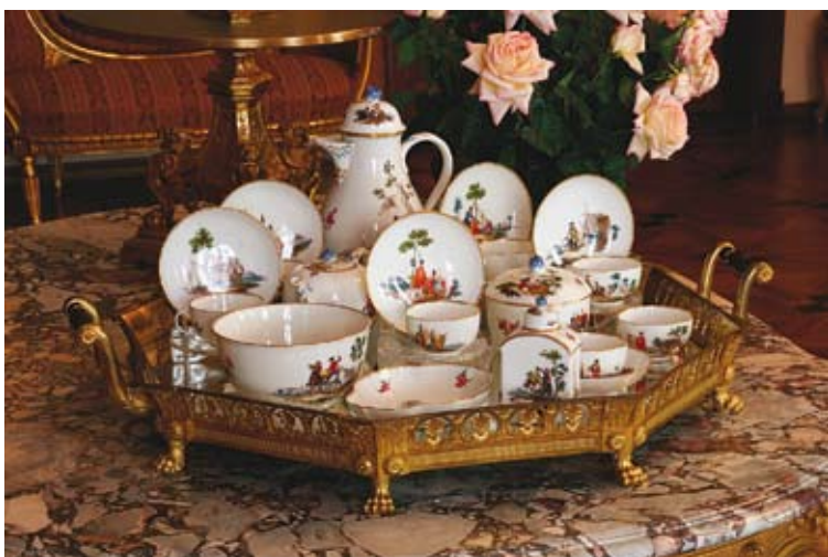
Serwis porcelanowy ze scenami wojskowymi, Saksonia, Miśnia, l. 1763–1774.