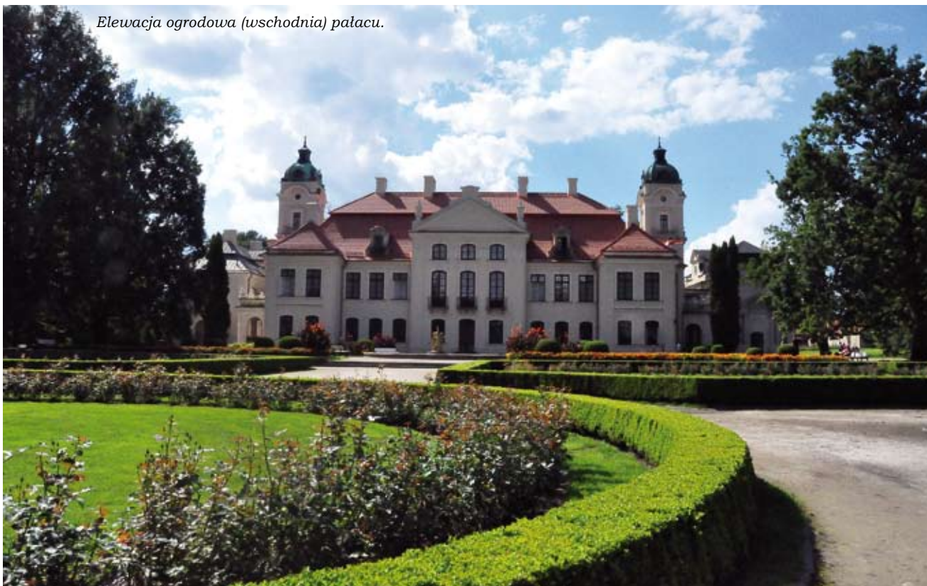
Elewacja ogrodowa (wschodnia) pałacu.