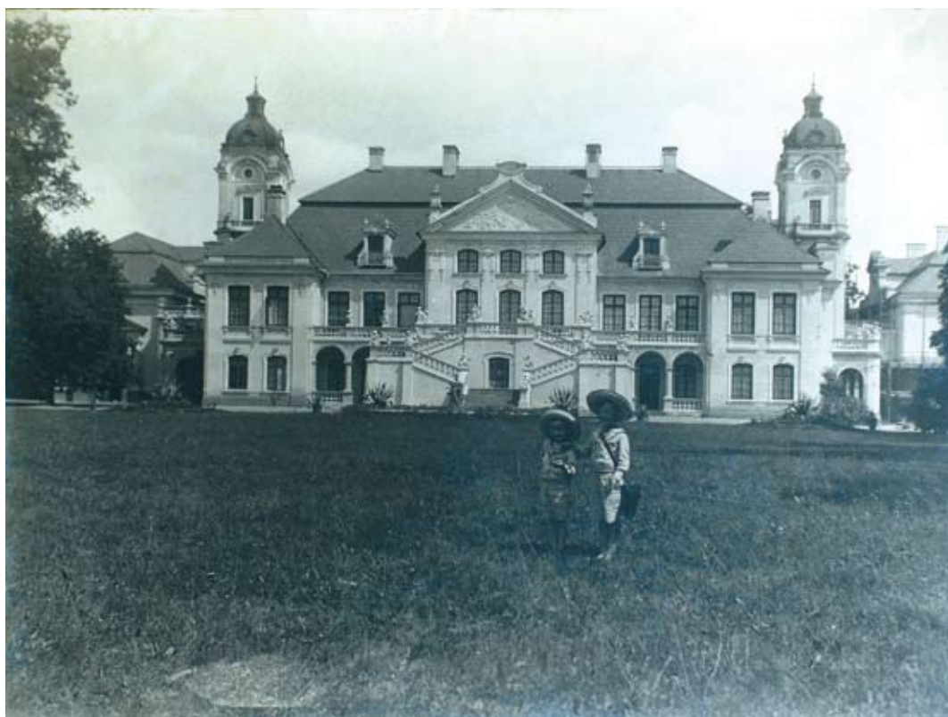
Elewacja ogrodowa (wschodnia) pałacu ok. 1910 r.

ną, kaplicę i teatralnię, a za parkiem nowe zabudowania folwarczne. Do elewacji ogrodowej pałacu dobudowano olbrzymi taras z podwójnymi schodami, a od frontu – portyk kolumnowy z herbem Zamoyskich w tympanonie. Dwie wieże oraz tarasy w elewacjach bocznych dopełniły całości przebudowy, której autorstwo